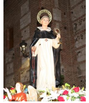
Hermandad de Nuestra Señora de los Santos y San Simón de Rojas